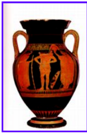
Vas - krigarens avsked

Om vi tittar vidare på denna vågade bild, ser vi också att skölden inte framställs som rund, utan den ses i stället från sidan. Nu har inte den egyptiska traditionen helt gått förlorad, utan bilderna bär fortfarande spår av en slags idealism, men vi kan se att denna idealism har knutits närmre det mänskliga idealet och avlägsnat sig från det utpräglat gudomliga i den egyptiska konsten. Människan har påbörjat sin resa mot självkänedom och iakttagande av det liv som pågår omkring henne. Det dröjer årtusenden innan den moderna konsten är ett faktum, och frigörelsen av de kreativa krafterna kulminerar.