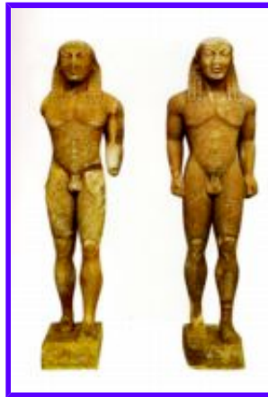
Bröderna Kleobis och Biton

I skulpturerna av Polymedes av Argos, föreställande bröderna Kleobis och Biton, från omkring 600 f. Kr., ser vi denna syntes av egyptiskt och grekiskt: